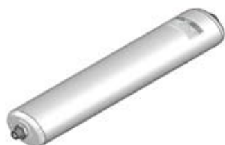
Disegno / Drawing 564