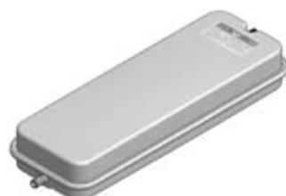
Disegno / Drawing 537/XL