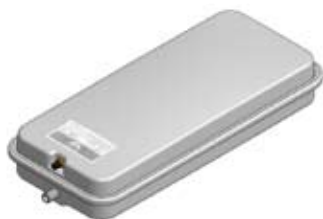
Disegno / Drawing 518