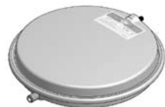
Disegno / Drawing 533