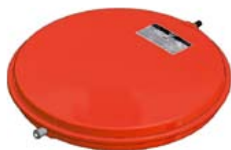
Disegno / Drawing 522/L