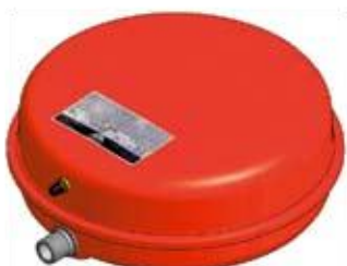
Disegno / Drawing 541/L