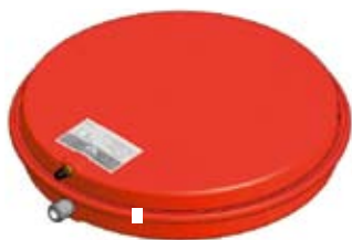
Disegno / Drawing 521/L