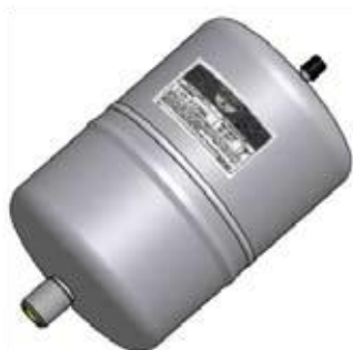
Disegno / Drawing 20016