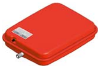
Disegno / Drawing P637/L