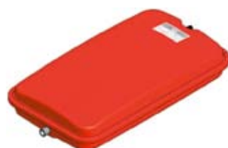
Disegno / Drawing 539/L