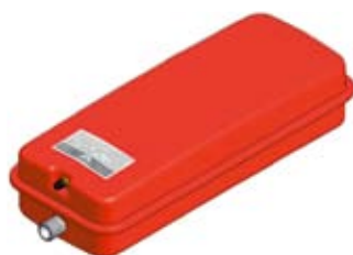
Disegno / Drawing 537/L