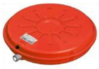
Disegno / Drawing 531/L