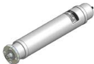
Disegno / Drawing 564/F