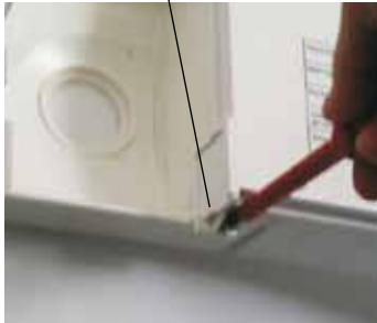
Крышка для параметрического штекера

Отключение котла выключателем не является его обесточиванием! Опасность поражения электрическим током на электрических частях оборудования! Запрещается прикасаться к электрическим деталям и контактам при подключенном к сети газовом бойлере. Опасно для жизни! К работам с электрооборудованием допускаются только уполномоченные специалисты (электрики).