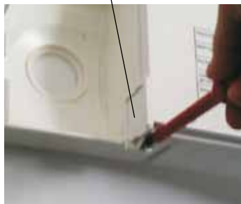
Couvercle du connecteur pour paramètres