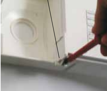
Καπάκι για φως παραμέτρων

Με τον διακόπτη ON/OFF του λέβητα δεν επέρχεται διακοπή παροχής ρεύματος! Υπάρχει κίνδυνος από ηλεκτρική τάση στα ηλεκτρικά εξαρτήματα. Μην βάζετε ποτέ τα χέρια στα ηλεκτρικά εξαρτήματα και στις επαφές αν δεν έχει γίνει προηγουμένως διακοπή ηλεκτρικού ρεύματος του λέβητα από το δίκτυο. Υπάρχει κίνδυνος θανάτου! Εργασίες στα ηλεκτρικά εξαρτήματα επιτρέπονται μόνο από αδειούχο τεχνικό.