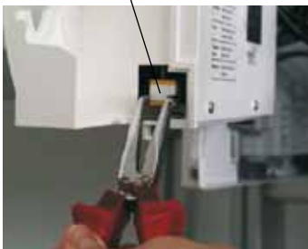
Boiler coding card

Ensure that the correct boiler coding card has been fitted. Otherwise there is a risk of damage to the appliance.