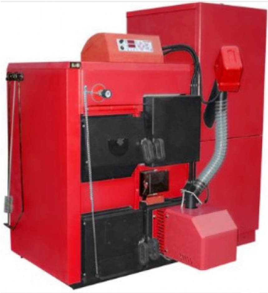
Wirbel Eko Ck Plus Pellet Set 25