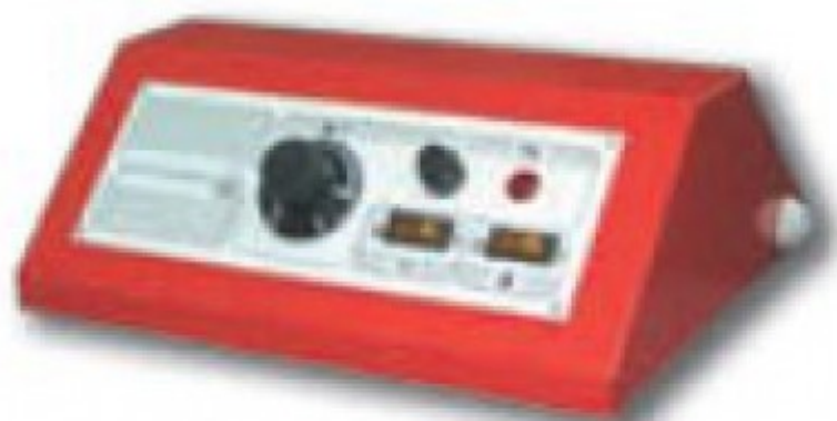
Пульт управления котла при работе с горелкой (опция)