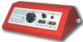
Пульт управления котла при работе с горелкой (опция)

Стальной водогрейный котел центрального отопления ЕКО-СКВ со встроенным бойлером из нержавеющей стали мощностью 30 – 50 кВт, работающий на твердом топливе (дрова, уголь). При снятии заглушки с нижней двери и установке пульта управления котел может работать с вентиляторной горелкой на солярке, газе или на пеллетах. Котел имеет лабиринтную конструкцию (топочная камера + 3 горизонтальных хода), позволяющую максимально использовать теплоту продуктов сгорания. При изготовлении котла применены качественные материалы и современные методы производства. Котел отвечает требованиям Европейских Норм EN 303-5.