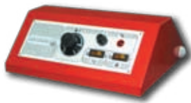
Пульт управления котла при работе с горелкой (опция)

Стальной водогрейный котел центрального отпления ЕКО-СК мощностью от 20 до 110 kW работающий на твердом топливе (дрова, уголь). При снятии заглушки нижней двери и установке пульта управления котел может работать с наддувной горелкой на солярке, газе или на пеллетах. Котел имеет лабиринтную конструкцию (топочная камера + 3 горизонтальных хода), позволяющую максимально использовать теплоту продуктов сгорания. При изготовлении котла применены качественные материалы и современные методы производства. Котел отвечает требованиям Европейских Норм EN 303-5.