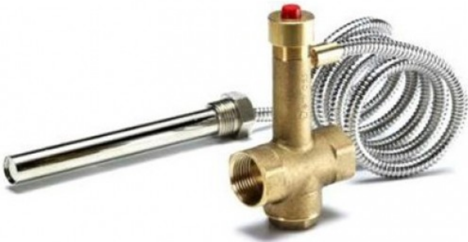
Клапан защиты от перегрева 3/4" с погружной гильзой