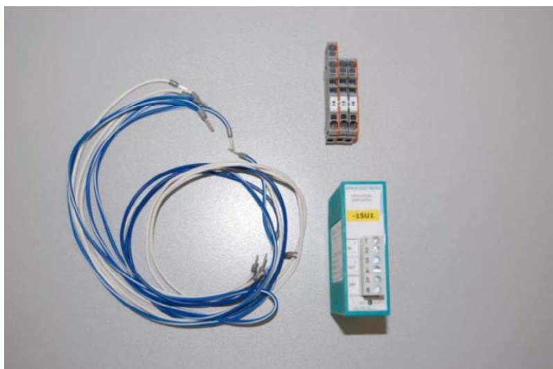
Конвертер сигналов. Провода для подключения. Клеммы.