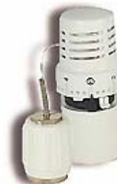
Термостатическая головка с выносным приводом SE 148 CD