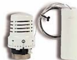
Термостатическая головка с выносным датчиком SE 148 SD