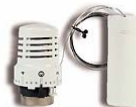
Термостатическая головка с выносным датчиком SE 148 SD