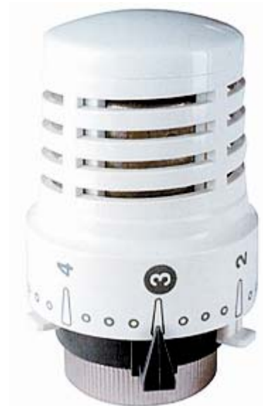
Термостатическая головка SE 148