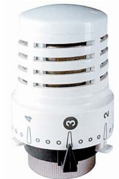
Термостатическая головка SE 148