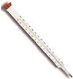
Спиртовой термометр T-200V