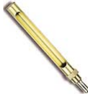
Латунная оправка T-200OT