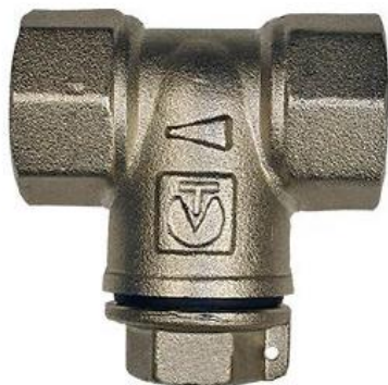
ФИЛЬТР МЕХАНИЧЕСКОЙ ОЧИСТКИ МАЛОГАБАРИТНЫЙ, ЛАТУННЫЙ, ПРЯМОЙ

Производитель: VALTEC s.r.l., Via Pietro Cossa, 2, 25135-Brescia, ITALY