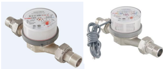
СЧЕТЧИК ХОЛОДНОЙ И ГОРЯЧЕЙ ВОДЫ КРЫЛЬЧАТЫЙ VLF торговой марки VALTEC

Уважаемый покупатель! ООО «СПУТНИК» и итальянская компания VALTEC S.r.l. благодарят Вас за приобретение нашей продукции. Внимательное ознакомление и соблюдение условий эксплуатации, изложенных в настоящем паспорте, позволят Вам продлить срок службы приобретенных Вами изделий.