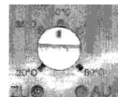
Рис. 1 Регулятор постоянной температуры подающей линии в среднем положении, под ним – лампочки-индикаторы рабочего состояния

Пульт дистанционного управления имеет датчик температуры помещения и термостат, на котором можно задать желаемую температуру помещения. Подсоединение ПДУ (Тип UA FBD, артикул 231 120) к регулятору UMM 10-10/150 T осуществляется в соответствии с рис. 3