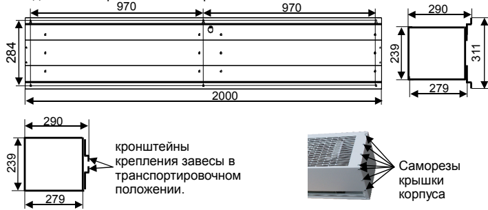
Вид ЗЭТ 18 с кронштейнами в рабочем положении.

В конструкцию, комплектацию или технологию изготовления изделия с целью улучшения его технических характеристик могут быть внесены изменения. Такие изменения вносятся в изделие без предварительного уведомления Покупателя и не влекут обязательств по изменению/улучшению ранее выпущенных моделей.