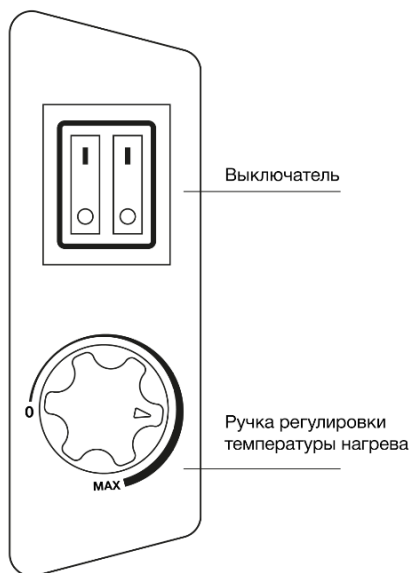
Рис. 2 Панель управления