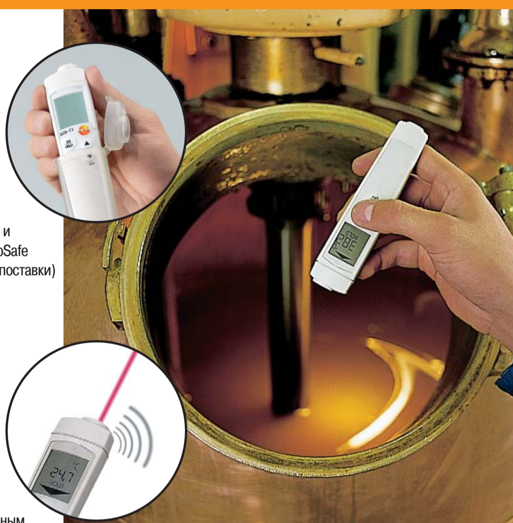
Сканирующие тесты температуры во время расфасовки жидкого шоколада

testo 826-T2 с лазерным целеуказателем и акустическим сигналом