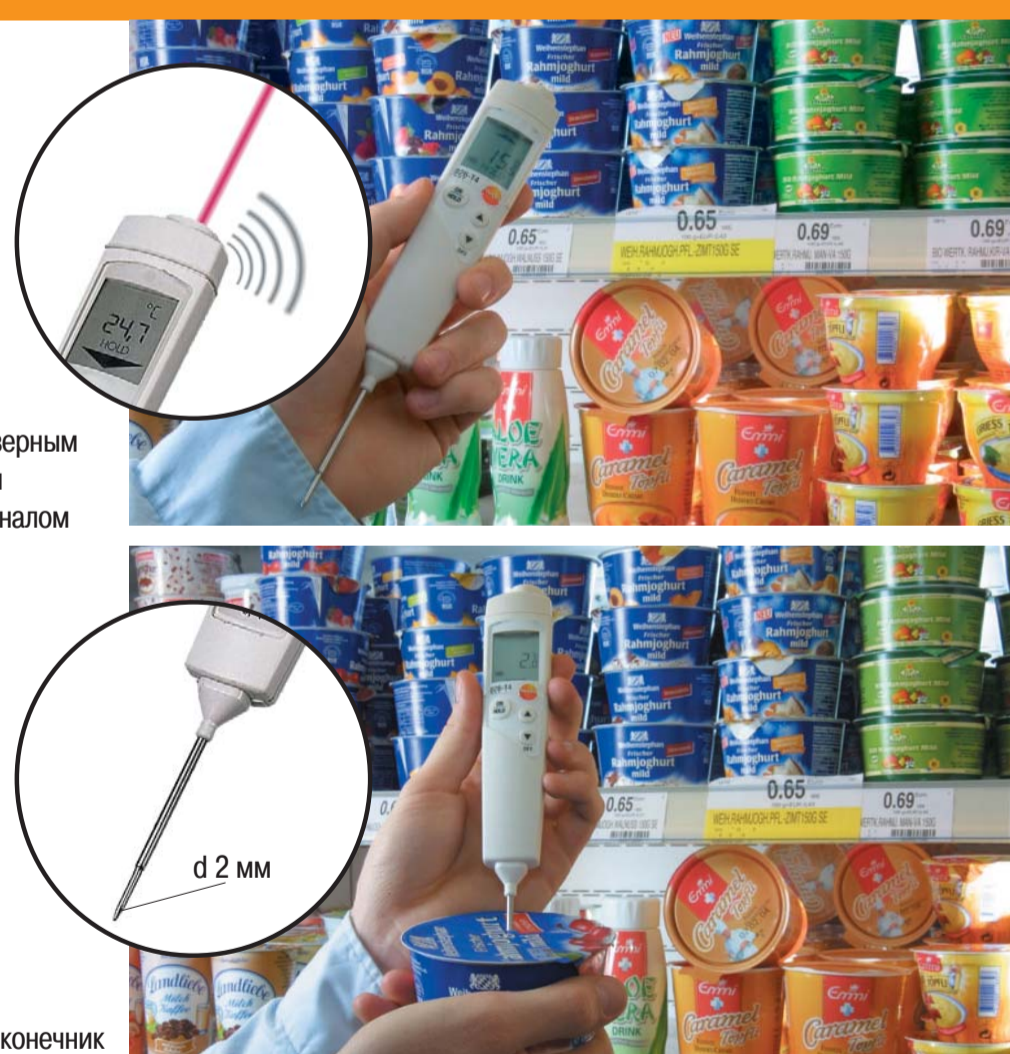
Тесты поверхностной температуры и измерения внутренней температуры

Тонкий, прочный измерительный наконечник