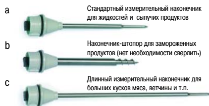
Стандартный измерительный наконечник для жидкостей и сыпучих продуктов