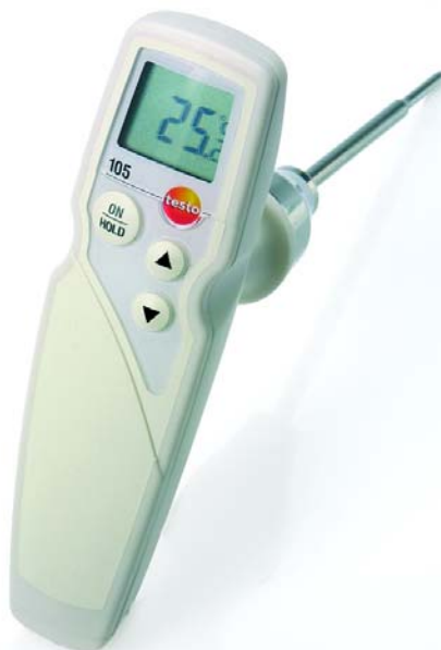
Прочный пищевой термометр со сменными измерительными наконечниками