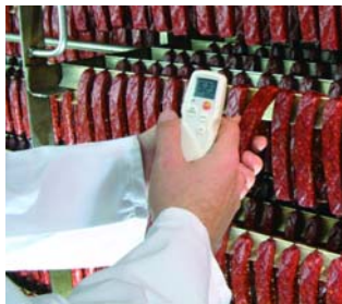
Быстрые и удобные измерения на производстве