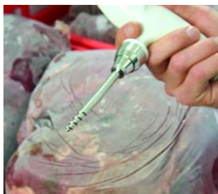
Специальный измерительный наконечник для замороженных продуктов