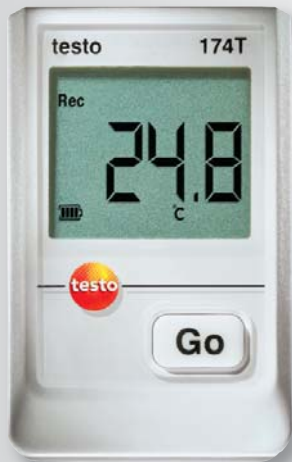
Реальный размер прибора