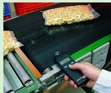
Измерения скорости/длины с использованием testo 470