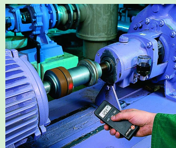
Измерения об/мин на насадках, валах с помощью testo 465