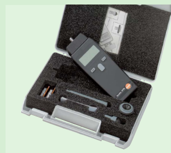
Полный комплект: распакуй, измерь, готово!