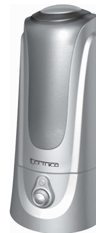
Модель АН 3-200 ТС