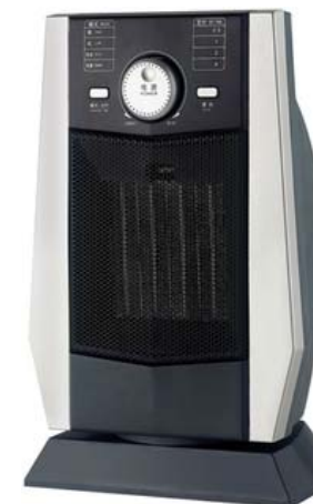
Модель SHL 1512 TC