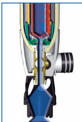
Процесс обратной промывки.