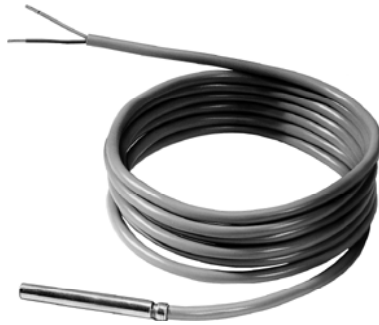
QAZ21... и QAZ36...