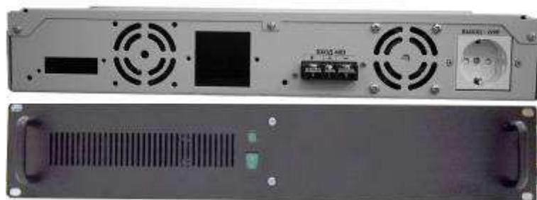
Исполнение 1 (19" модуль высотой 2U)

4.2 Конструктивно ИЗДЕЛИЕ выполнено в двух исполнениях (см. рисунок 1 и строки 14 и 15 таб. 1).