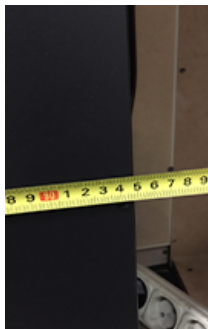
Ширина – 95 см (включая крепежные выступы).