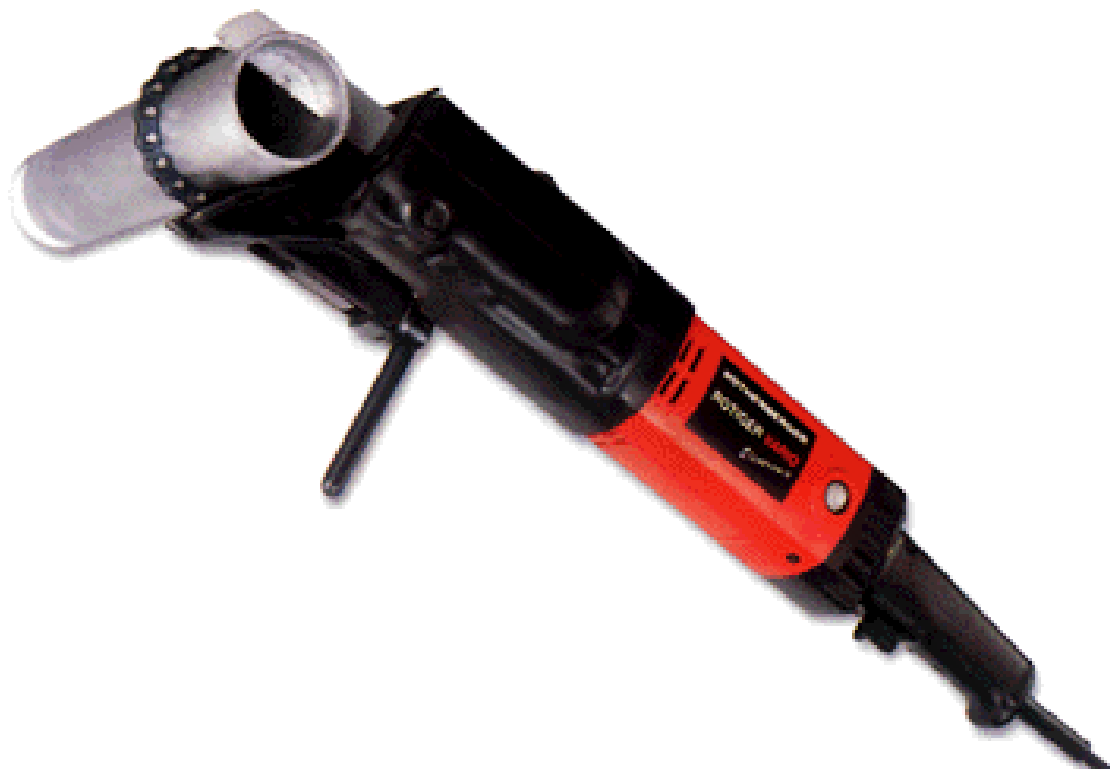
электропила модель ROTIGER VARIO