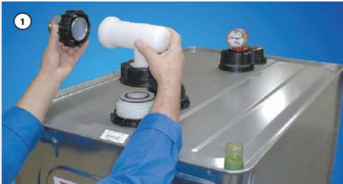
Установка отдельного резервуара

Гарантия предоставляется только при соблюдении положений данного руководства, а также всех других предписаний _