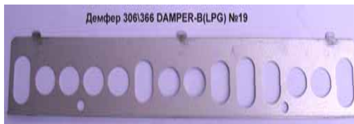
Демфер 306\366 DAMPER-B(LPG) №19