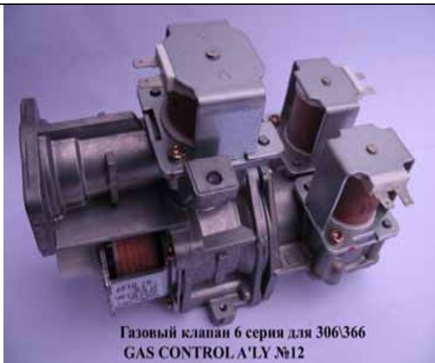
Газовый клапан котла Rinnai 6 серия (Цена 3060 руб)