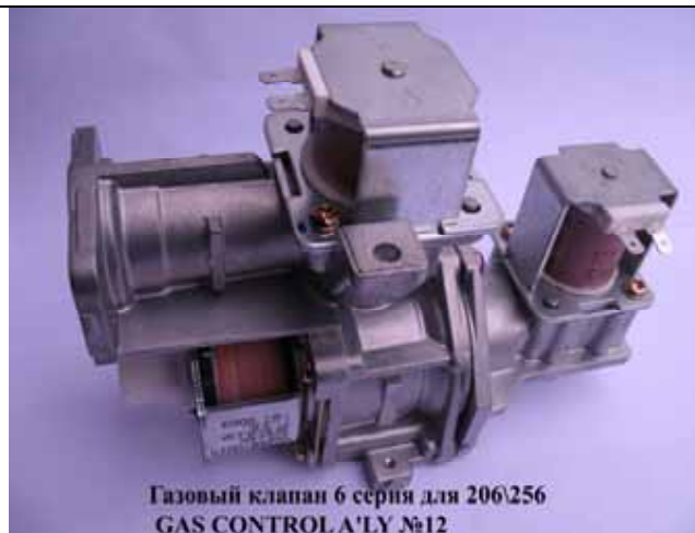
Газовый клапан котла Rinnai 6 серия (Цена 3060 руб)