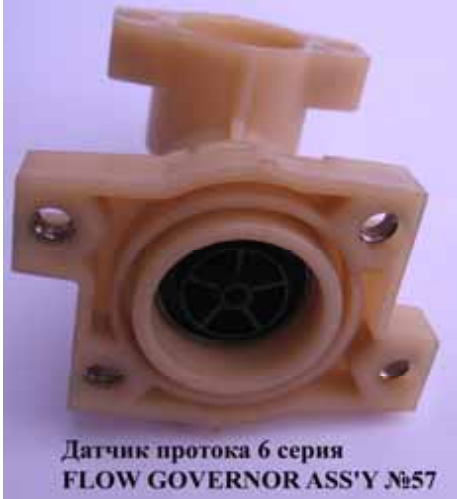
Датчик протока 5-6 серии котла Rinnai (Цена 230 руб)