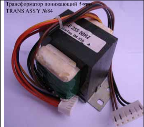
Трансформатор понижающий котла Rinnai (Цена 893 руб)