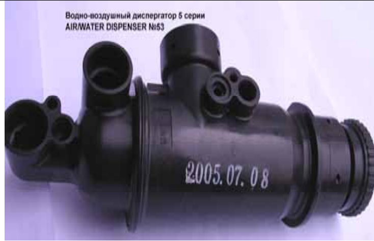
Водно-воздушный диспергатор котлов Rinnai 5 серии (Цена 638 руб)