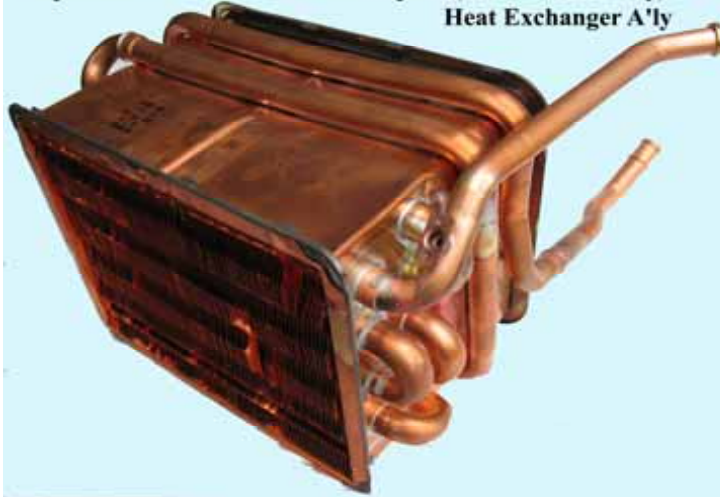
Первичный теплообменник 5-6 серии (контур отопления) котла Rinnai (Цена 10200 руб)