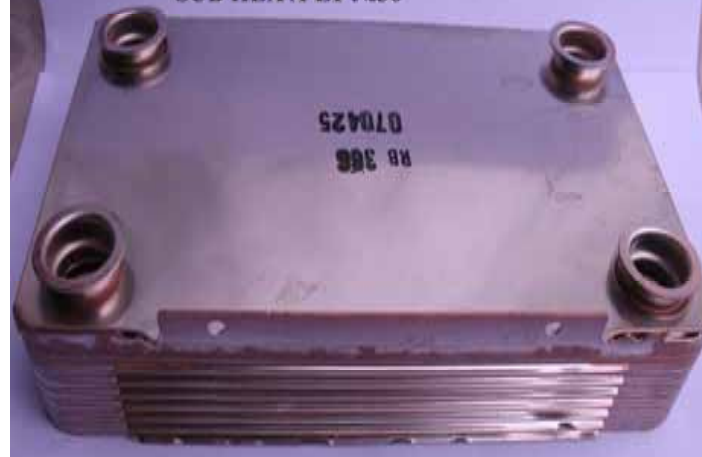
Теплообменник ГВС (контур горячей воды) котла Rinnai (Цена 5100 руб)