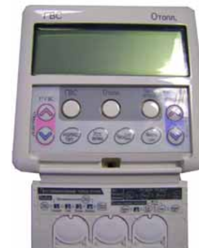
Цифровой пульт управления котлом Rinnai DMF (Delux) (Цена 1900 руб)