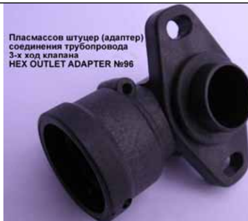
Пласмассов штуцер (адаптер) соединения трубопровода 3-х ход клапана HEX OUTLET ADAPTER №96