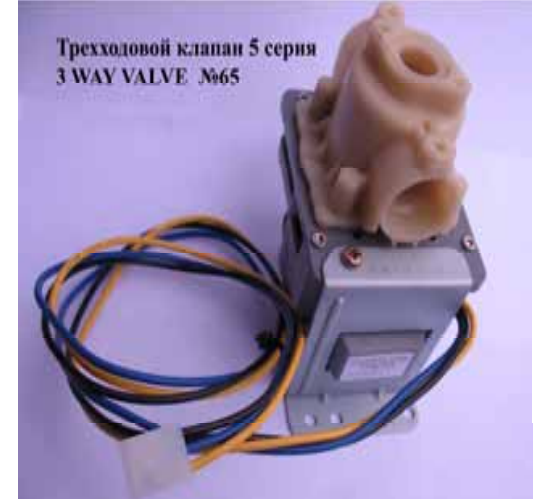
Трехходовой клапан 5 сер. (для переключения на горячую воду) котла Rinnai (Цена 1148 руб)