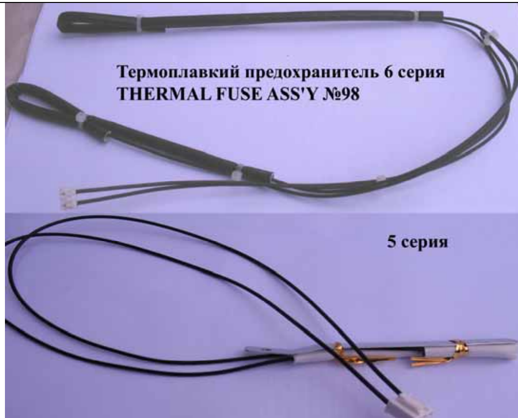
Термоплавкий предохранитель 6 серия THERMAL FUSE ASS'Y №98