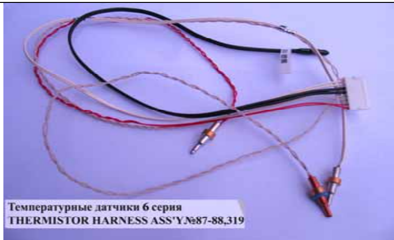
Температурные датчики 6 серия THERMISTOR HARNESS ASS'Y №87-88,319