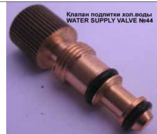
Клапан подпитки хол.воды WATER SUPPLY VALVE №44