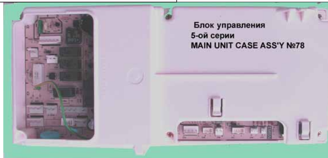
Блок управления 5-ой серии MAIN UNIT CASE ASS'Y №78

Электронный блок управления Rinnai 6 серии (Цена 6375 руб)