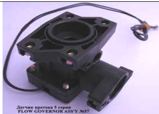
Датчик протока 5 серии FLOW GOVERNOR ASS'Y №57