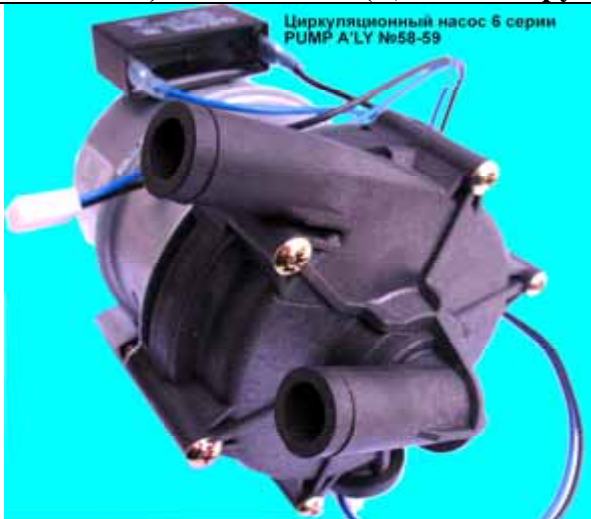
Циркуляционный насосы котла Rinnai 6 серии (Цена 3186 руб)