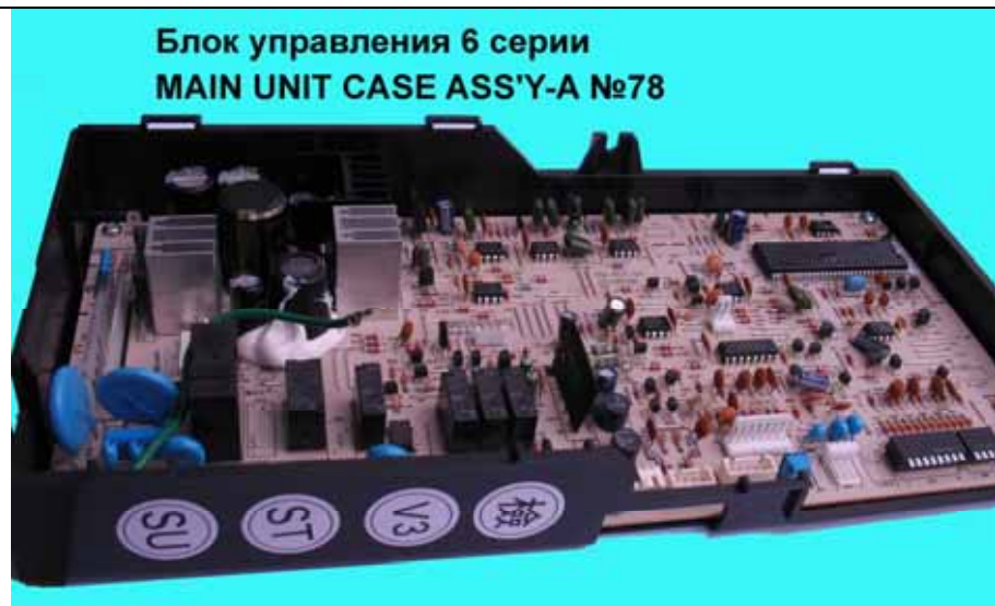
Блок управления 6 серии MAIN UNIT CASE ASS'Y-A №78

Электронный блок управления Rinnai 6 серии (Цена 6375 руб)