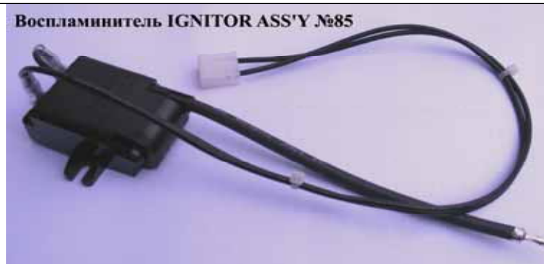
Воспламинитель IGNITOR ASS'Y №85