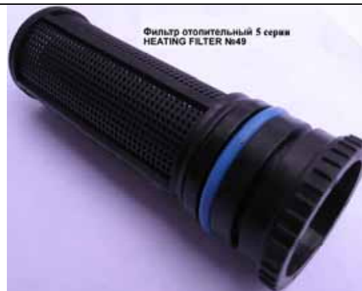
Фильтр отопительный котлов Rinnai 6 серии (Цена 242 руб)