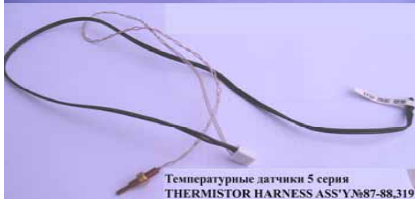
Температурные датчики 5 серия THERMISTOR HARNESS ASS'Y №87-88,319