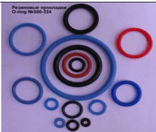
Резиновые прокладки (кольца) котла Rinnai (10 руб)