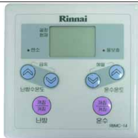
Цифровой пульт управления котлом Rinnai SMF (Цена 1530 руб)

Вентилятор в сборе котла Rinnai (Цена 2550 руб)