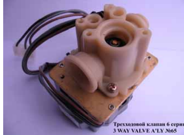
Трехходовой клапан 6 сер. (для переключения на горячую воду) котла Rinnai (Цена 1148 руб)