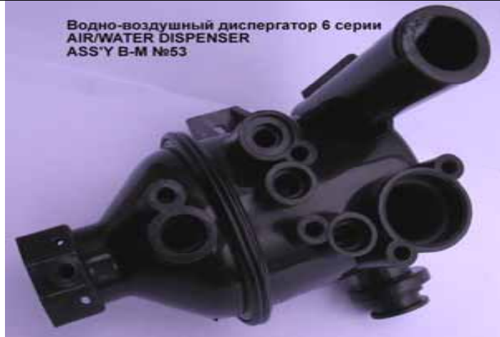
Водно-воздушный диспергатор котлов Rinnai 6 серии (Цена 638 руб)