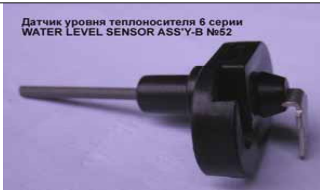
Датчик уровня теплоносителя котла Rinnai (Цена 30 руб)