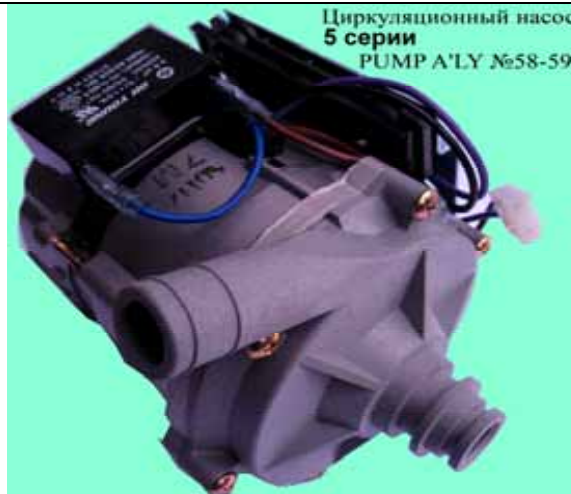
Циркуляционные насосы котла Rinnai 5 серии (Цена 3186 руб)