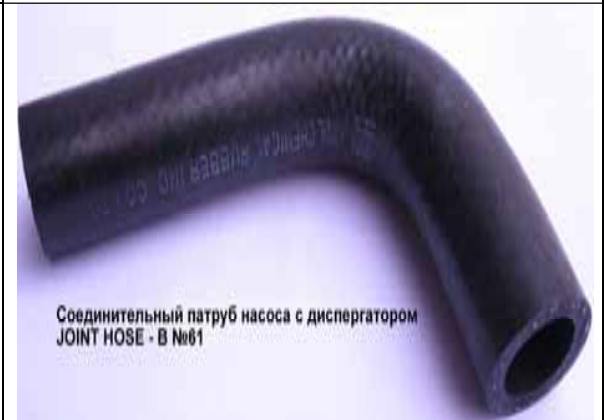
Цена 60 руб