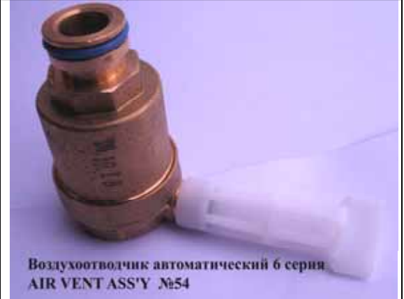
Воздухоотводчик автоматический котла Rinnai (Цена 383 руб)