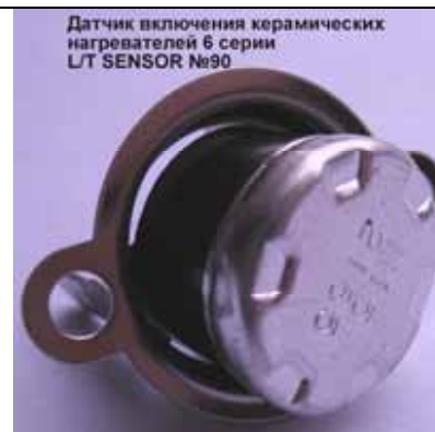
Датчик включения керамических нагревателей котла Rinnai (Цена 180 руб)