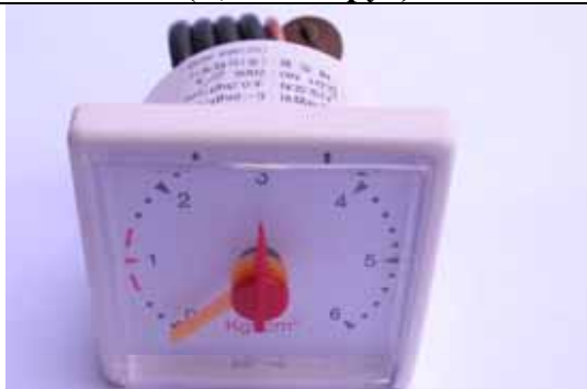
Манометр 6- серии с панелью в сборе BODY CONTROL PANEL ASS'Y-B №80