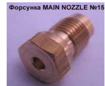
Форсунка MAIN NOZZLE №15