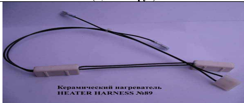
Керамический нагреватель HEATER HARNESS №89