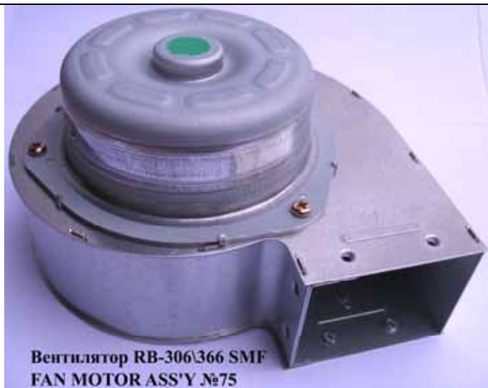
Вентилятор RB-306/366 SMF FAN MOTOR ASS'Y №75

Вентилятор в сборе котла Rinnai (Цена 2550 руб)