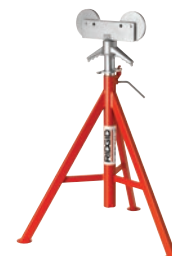
Опоры для труб с роликовыми головками