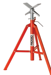
Опоры для труб с V-образными головками