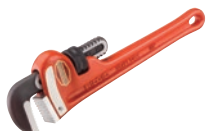
Прямые ключи для больших нагрузок