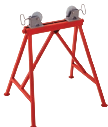
Регулируемая опора со стальными роликами