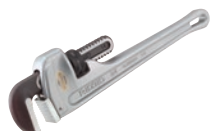
Прямые алюминиевые ключи