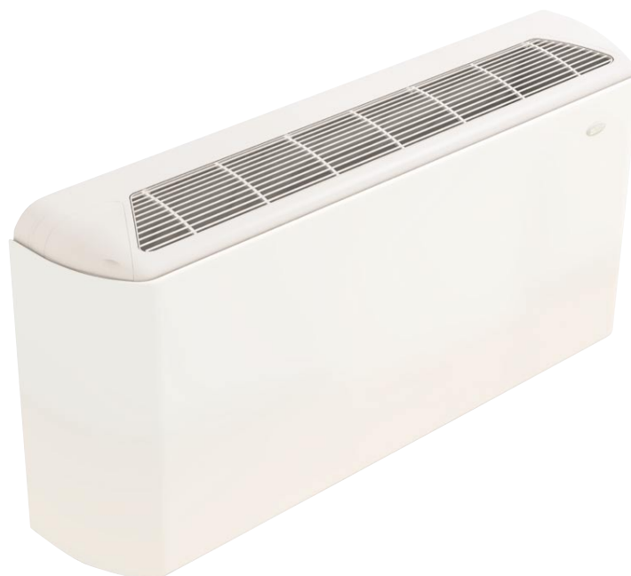
Рис. 6. Вертикальный фэн-койл MFU