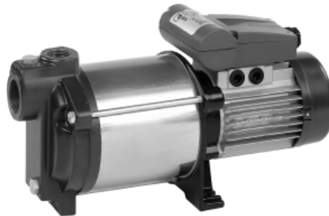
Multi Eco E и D