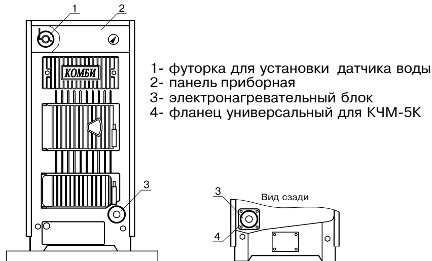
Рис.1 Установка электронагревательного блока на котле.

Блок нагревательных элементов состоит из трех ТЭНов, имеющих общий фланец с резьбой G2-B и защитного колпака с сальником. В корпус фланца установлен датчик обратной воды. Провода от нагревательных элементов и датчика проходят через сальник и фиксируются в нем. Блок нагревательных элементов (3) закручивается в универсальный фланец для КЧМ (4) через уплотнительную прокладку. Фланец устанавливается вместо заглушки на обратном трубопроводе сзади котла. Если расположение котла не позволяет установить ТЭНБ сзади, то возможна установка спереди котла, вместо заглушки у шуровочной дверцы. Датчик прямой воды устанавливается в футорку (1), которая служит также для установки тягорегулятора.