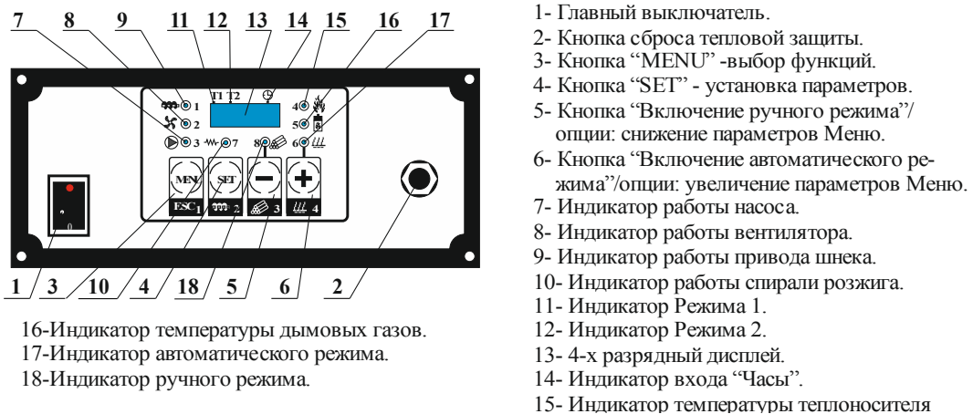
Рис.1. Внешний вид панели управления.

Внешний вид панели управления показан на рис.1.