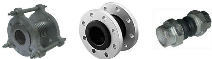
Рисунок 13 – Компенсаторы

Компенсаторы предназначены для предотвращения образования механических напряжений при монтаже, а также во избежание передачи вибрации и шумов на напорный трубопровод (см. рисунок 13).