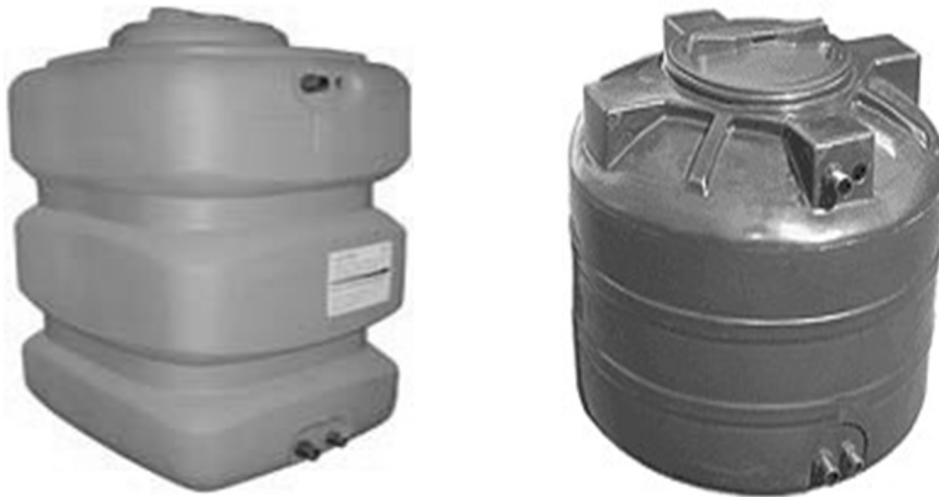
Рисунок 12 – Безнапорный резервуар

Для монтажа приемного резервуара действуют такие же правила, как и для самой установки. Днище резервуара должно полностью прилегать к прочному фундаменту. При расчете несущей способности фундамента нужно учитывать максимально допустимый объем, заливаемый в соответствующий резервуар.