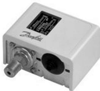
Рисунок 9 – Реле давления с защитой от сухого хода

Реле давления с защитой от сухого хода предназначено для контроля давления на входе и выдачи аварийного сигнала для отключения насосных агрегатов. Уставка отключения насосных агрегатов регулируется с помощью настроечных винтов. На рисунке 9 представлено реле давления.