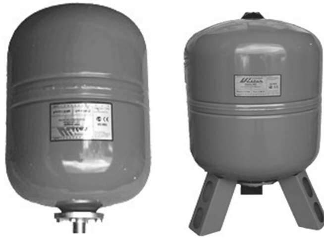
Рисунок 10 – Мембранный напорный резервуар