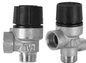
Рисунок 11 – Предохранительный клапан

На рисунке 11 представлен предохранительный клапан.