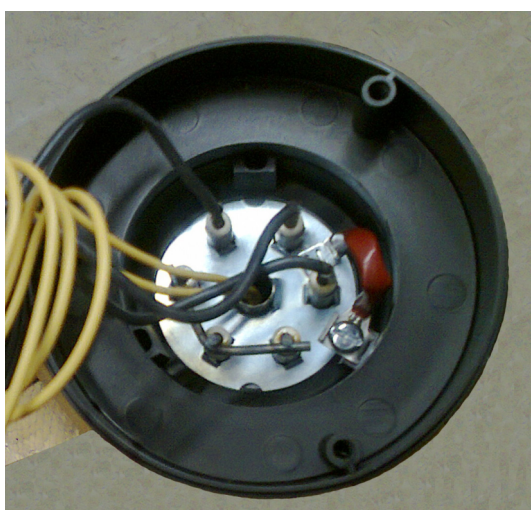
Рис.1 Подключение заземляющего проводника РЕ