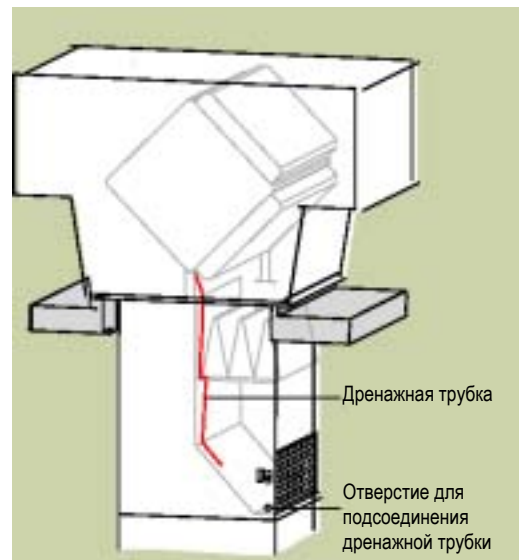
Рис. 1: Конструкция агрегата