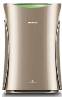
Очистители с функцией увлажнения ECOLife Champagne Brilliant