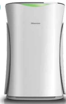
Очистители с функцией увлажнения ECOLife White Brilliant

Серия ECOLife создана с применением самых современных разработок и инновационных технологий в области очистки и увлажнения воздуха. Используемая запатентованная инновационная NANOE технология от Panasonic эффективно увлажняет и очищает воздух в помещении благодаря выработке особых папое частиц. Микрочастицы папое содержат больше влаги и обладают повышенным жизненным циклом в отличие от отрицательно заряженного иона, обеспечивая интенсивное увлажнение воздуха. Микроскопические размеры позволяют проникать в практически любые виды тканей, эффективно уничтожая вирусы, бактерии, споры грибов, неприятные запахи и другие загрязнения.