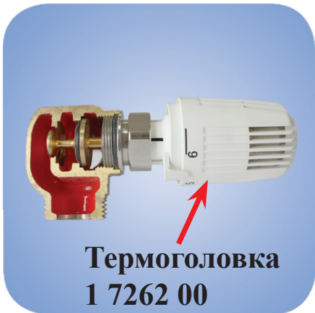
Термоголовка 1 7262 00