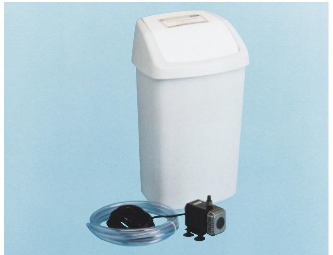
Устройство промывки GENO- UV-установок

Устройство промывки установок ультрафиолетового обеззараживания GENO-UV