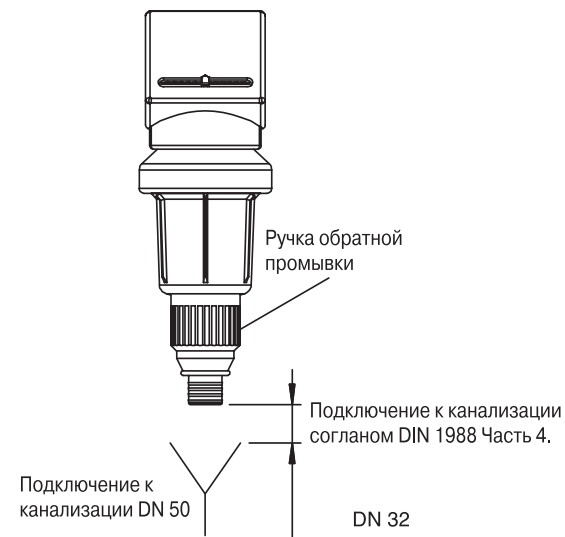
Рис. 1.1: Подключение к канализации

Внимание! Гайки затягивать крест накрест.