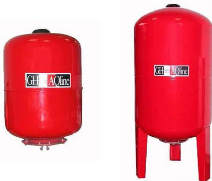
General Hydraulic AQline

Мембранные расширительные баки для систем отопления и водоснабжения 8, 19, 24, 36, 50, 80, 100 л.