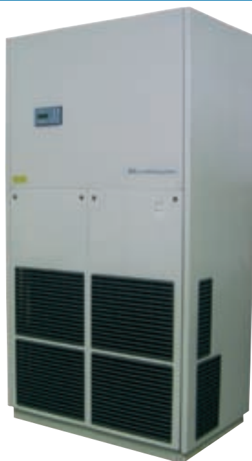
ED.P 181 SF.E K