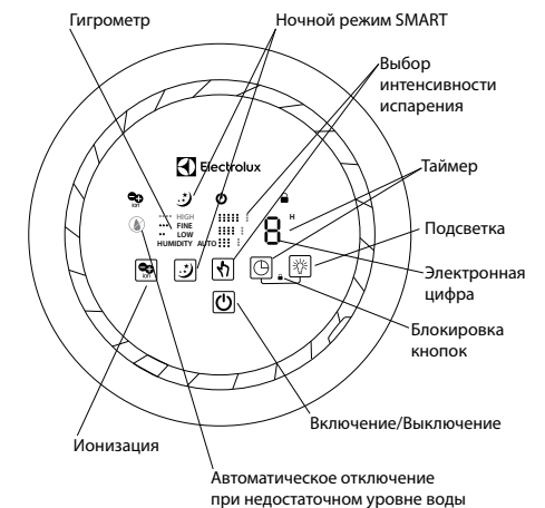
Рис. 3. Дисплей и панель управления