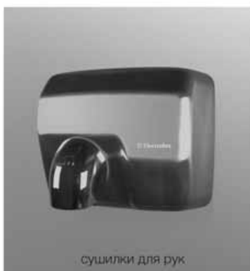
сушилки для рук