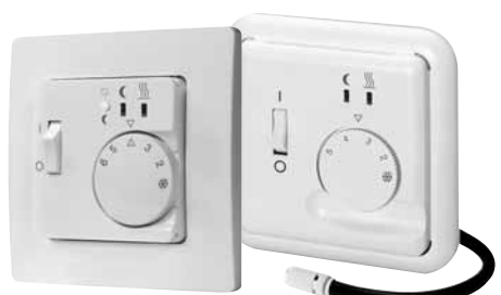
Крышка 2 части, 50-50 мм