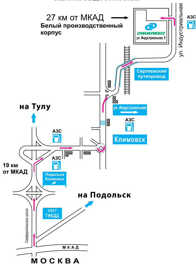
СХЕМА ПРОЕЗДА ОТ МОСКВЫ