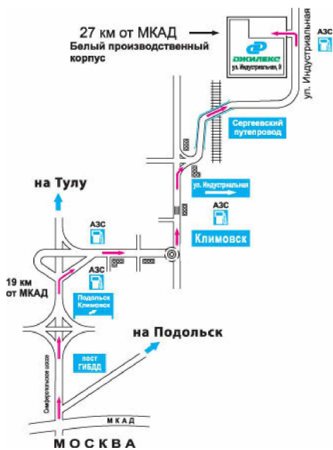
СХЕМА ПРОЕЗДА ОТ МОСКВЫ

Завод изготовитель, Сервисный центр Зал оптово-розничной торговли