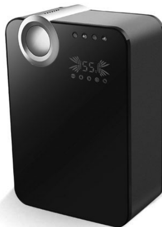
Модель D-H50UCF-W D-H50UCF-B