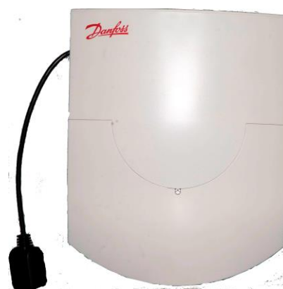
Сетевой узел типа NNV