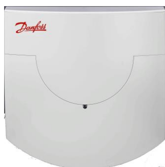
Сетевой узел типа NNB