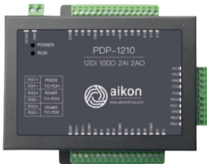
Модель PD P – 1210